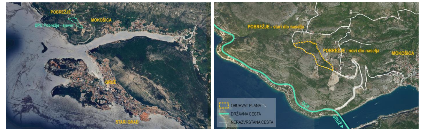
Područje obuhvata Plana prikazano na orto foto snimci, šira i uža situacija

Predmetni obuhvat Plana smješten je na području koje administrativno pripada Gradu Dubrovniku, u naselju Pobrežje. Područje obuhvata u cijelosti je smješteno unutar zaštićenog obalnog područja (ZOP - područje od posebnog interesa za RH), odnosno unutar prostora ograničenja koji obuhvaća pojas kopna u širini od 1000 m od obalne crte i pojas mora u širini od 300 m od obalne crte. Nalazi se neposredno uz novi dio naselja Pobrežje, a od Gruža je udaljeno približno 2000 m zračne linije. Području obuhvata se iz smjera Gruža pristupa s nerazvrstane ceste koja spaja Osojnik i državnu cestu D8 (most dr. Franja Tuđmana).